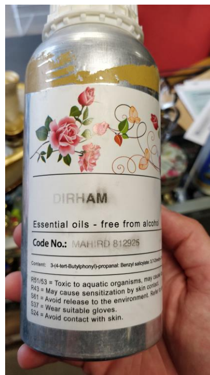
Tillsyn av parfymoljor som inte är tillåtna på marknaden.

Miljöförvaltningen har tillsammans med läkemedelsverket tillsyn på försäljningen av receptfria läkemedel i butik. Alla försäljningsställen av receptfria läkemedel måste anmäla detta till läkemedelsverket och köpa sina läkemedel från distributörer med partihandelstillstånd. Under tillsyn har butiker som varken har anmält till läkemedelsverket eller inhandlat sina läkemedel från godkända distributörer upptäckts. Redan anmälda butiker anger att det finns en svart marknad med olagliga läkemedel. Tillsammans med tillståndsenheten och polisen har butiker som inte är anmälda kontrollerats. Vid de besöken har polisen har beslagtagit läkemedel som inte går att spåra. Miljöförvaltningen kan inte själv beslagta läkemedel men det kan polisen, vilket innebär att samarbetet leder till att olagliga läkemedel snabbt tas bort från marknaden. Detta samarbete är nytt sedan projektet