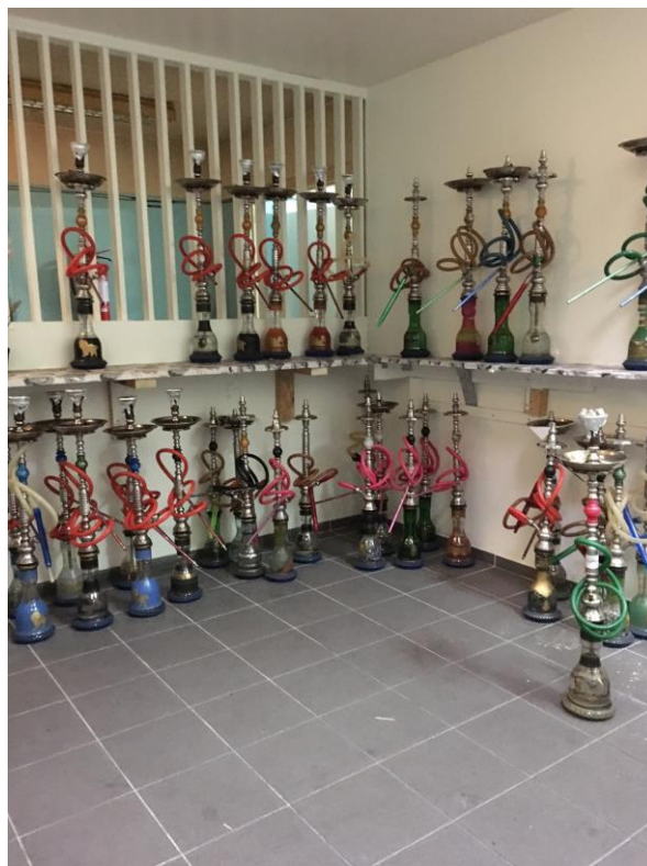
I en föreningslokal hittar inspektörerna ett 100-tal färdigpreparerade vattenpipor som röks inomhus.

Röken från en vattenpipa innehåller en blandning av tobaksrök och rök från kolen som håller tobaken glödande. Analyser av röken visar att den innehåller minst lika mycket kolmonoxid, tjära, tungmetaller och cancerframkallande ämnen som cigarett rök. Det faktum att kol används ökar hälsoriskerna eftersom även den genererar kolmonoxid, metaller och cancerogena ämnen. Vid vattenpiprökning under en timme kan en lika stor volym rök inhaleras som den från cirka 100 cigaretter. Vattnet som kyler ner röken filtrerar inte bort alla giftiga ämnen och partiklar. Den passiva rökningen, det vill säga att vistas i lokalerna utan att själv röka, är minst lika farlig som vid cigarett rökning och det finns inga bevis för att något tillbehör kan göra vattenpiprökningen säkrare.