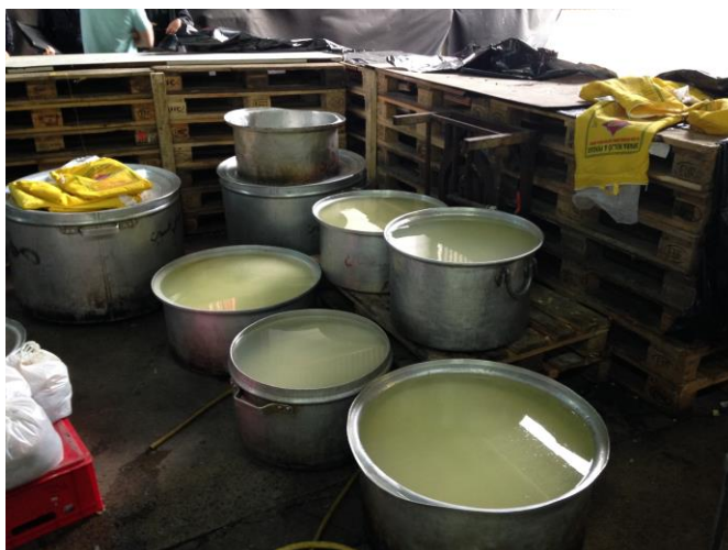
Tillsyn av oregistrerad livsmedelsverksamhet.

Kartläggning och uppföljning av kända livsmedelslokaler som upphört har varit en effektiv metod för att hitta flera registrerade verksamheter. Det är viktigt att kontinuerligt hitta dessa verksamheter för att kunna utföra kontroller så att malmöborna får säker mat och företagen konkurrerar på lika villkor.