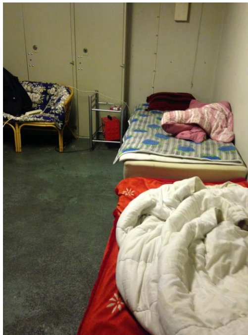
Ett av de många olovliga boendena som hittats i en industrilokal under projektet.

Inom projektet har mycket tillsyn lagts på olovliga boenden. Olovliga boenden är med stor sannolikhet en del av Malmös svarta ekonomi där utsatta grupper och illegal arbetskraft utnyttjas. Olovliga boenden har hittats i allt från källare, industrier, grossister till verkstäder. Den här typen av boende utgör en allvarlig olägenhet för människors hälsa. Tillsynen har bedrivits framförallt tillsammans med räddningstjänsten och stadsbyggnadskontoret. Denna samordning är mycket framgångsrik där förvaltningen kan underbygga sina beslut med hjälp av både räddningstjänstens och stadsbyggnadskontorets beslut. Även skatteverkets folkbokföringsenhet har informerats när dessa boenden har upptäckts.